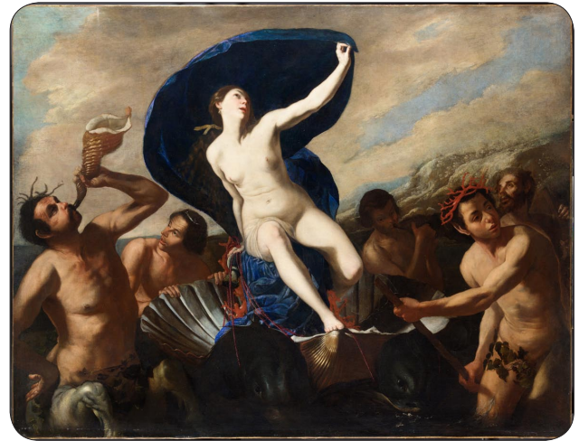
B. Cavallino - Nascita di Galatea, coll. priv.

barocco ideale, mostra di se stessa ma anche contenitore prestigioso per tre rassegne strategiche: “Il barocco in Certosa”, “Scultura barocca” e “Ritratti storici e immagini della città”. Come dice Spinosa, la Certosa appare come un viaggio nell’incredibile “teatro del sacro” in chiave barocca, tra la sua chiesa con gli ambienti adiacenti, la Farmacia affrescata da Paolo de Matteis, dove sono esposti oggetti e sculture selezionati per l’occasione, e le sale che furono destinate a ospitare le “immagini e memorie della città”, e dove ora sfilano, per questa rassegna, anche altri ritratti di artisti e personaggi storici, firmati da Andrea de Lione, da Cavallino, da Solimena, da De Mura o da Bonito, e altre “vedute” della città, di Didier Barra, di Gaspar van Wittel o di Leonardo Coccorante.