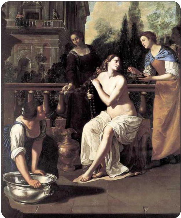
A. Gentileschi - Betsabea al bagno Ohio, Columbus Museum of Art

sopra un fallo, mentre si giocava alla racchetta” in Campo Marzio. È La Flagellazione ad accogliere i visitatori perché con Caravaggio comincia la scuola napoletana del Seicento. Le poche opere che realizza a Napoli scatenano una vera e propria febbre di caravaggismo. Le opere scelte per l'esposizione, molte inedite, a partire da Battistello Caracciolo e Carlo Sellitto danno il senso dell'atmosfera febbrile e sperimentale che si respirava a Napoli