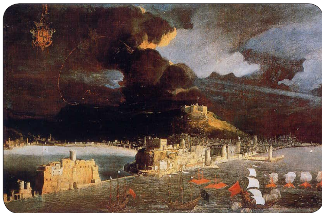
Didier Barra - Veduta di Napoli dal mare, coll. priv.