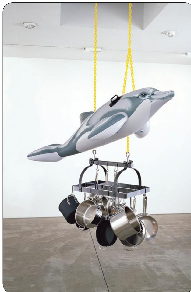
Museo Madre :Jeff Koons - Dolphin (Delfino), 2002

Secondo alcuni viviamo in un'epoca barocca anzi in un'epoca che vive gli eccessi del Barocco. Lo dice il dilagare di gesti eccessivi e teatrali che affiora un po' do-