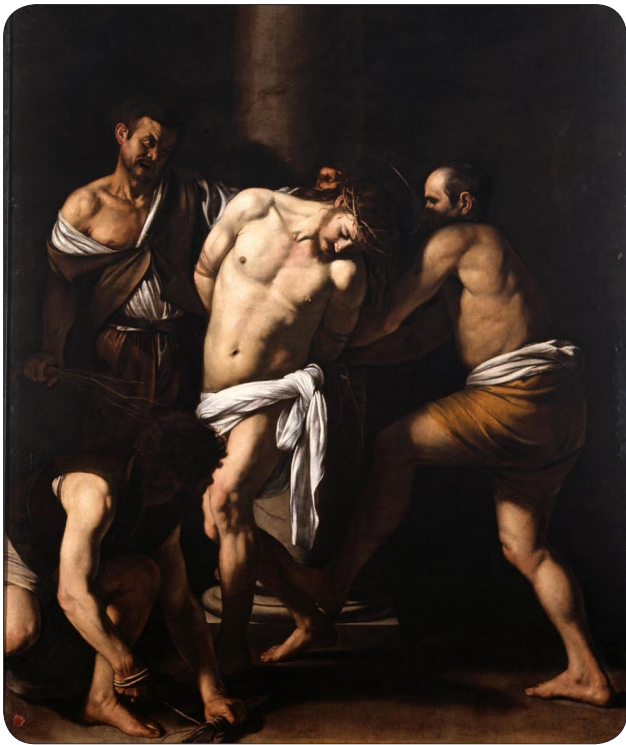
Caravaggio . La Flagellazione , Museo di Capodimonte