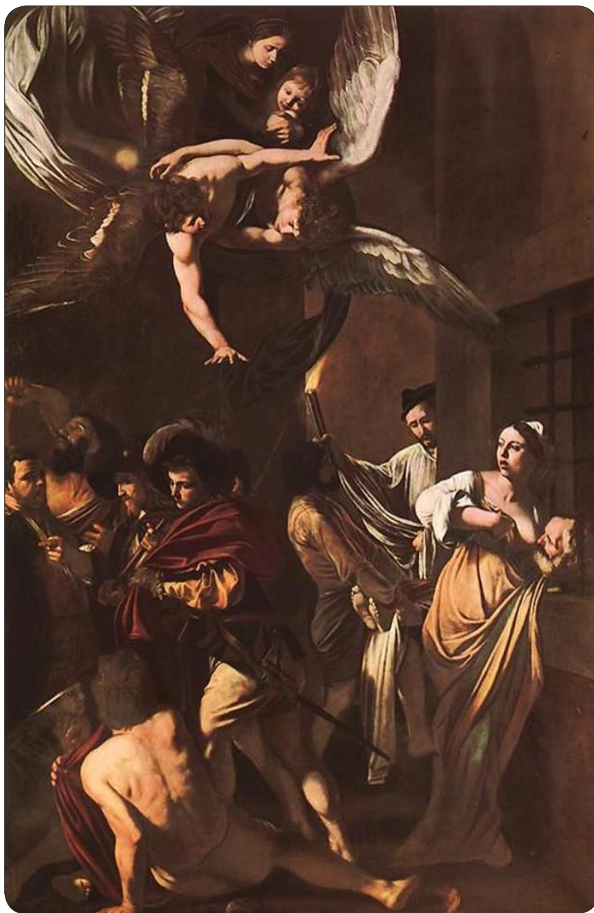
Caravaggio - Le sette opere della Misericordia