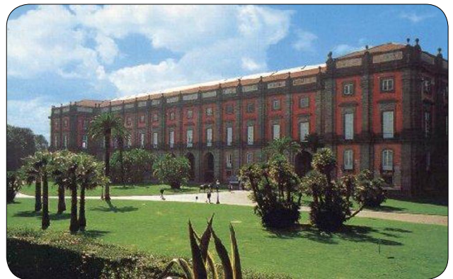
Museo di Capodimonte

barocco ideale, mostra di se stessa ma anche contenitore prestigioso per tre rassegne strategiche: “Il barocco in Certosa”, “Scultura barocca” e “Ritratti storici e immagini della città”. Come dice Spinosa, la Certosa appare come un viaggio nell’incredibile “teatro del sacro” in chiave barocca, tra la sua chiesa con gli ambienti adiacenti, la Farmacia affrescata da Paolo de Matteis, dove sono esposti oggetti e sculture selezionati per l’occasione, e le sale che furono destinate a ospitare le “immagini e memorie della città”, e dove ora sfilano, per questa rassegna, anche altri ritratti di artisti e personaggi storici, firmati da Andrea de Lione, da Cavallino, da Solimena, da De Mura o da Bonito, e altre “vedute” della città, di Didier Barra, di Gaspar van Wittel o di Leonardo Coccorante.