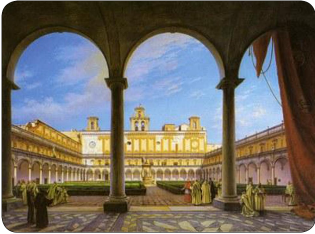
La Certosa e Museo di San Martino